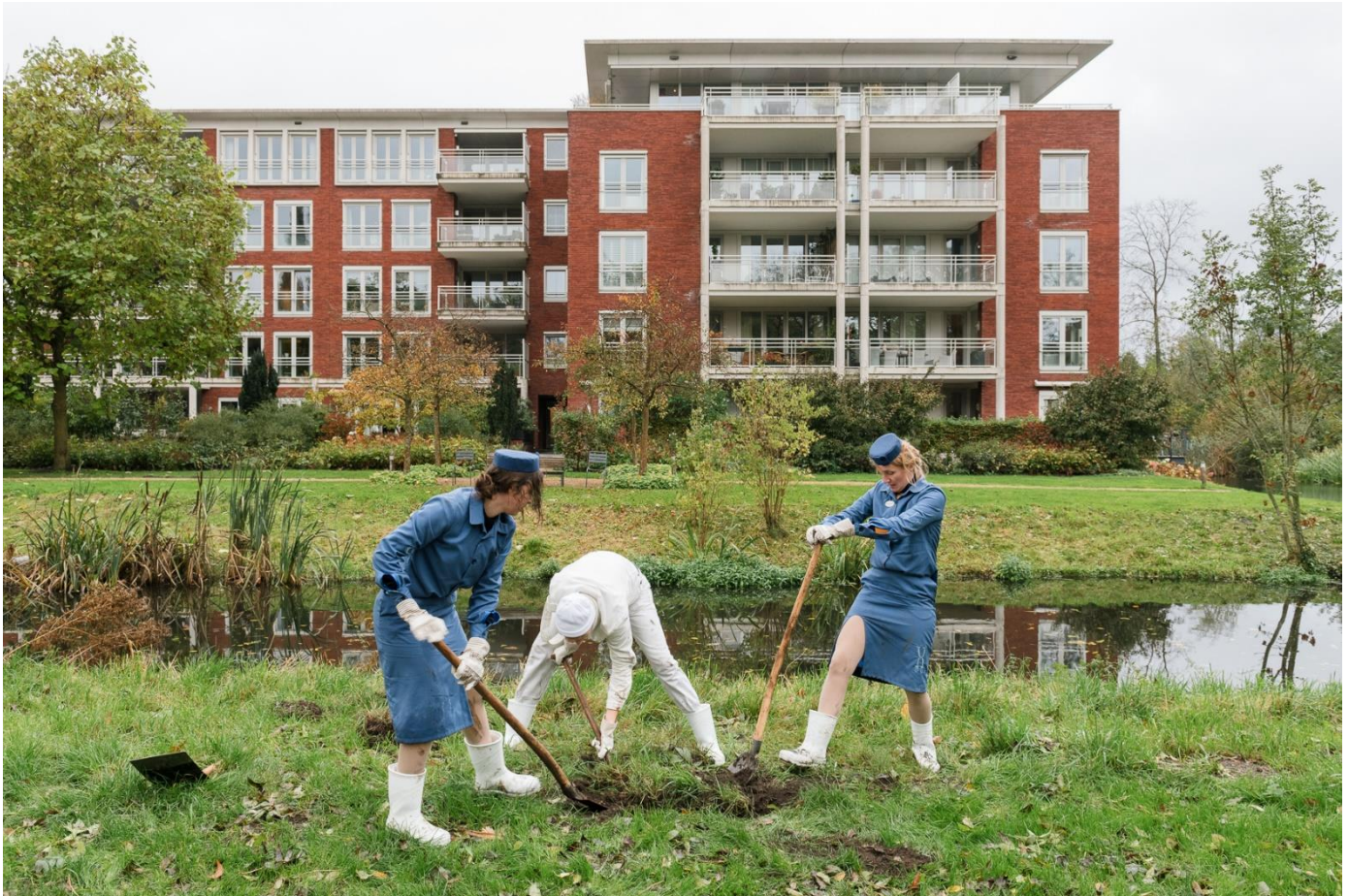
„Hosting Soil“, Performative Intervention, 2021, Amsterdam Zuid